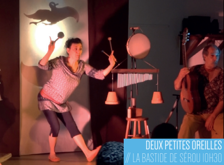
DEUX PETITES OREILLES // LA BASTIDE DE SEROU 10H30