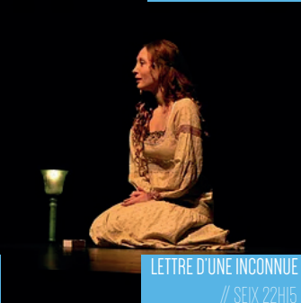
LETTRE D'UNE INCONNUE // SEIX 22H15