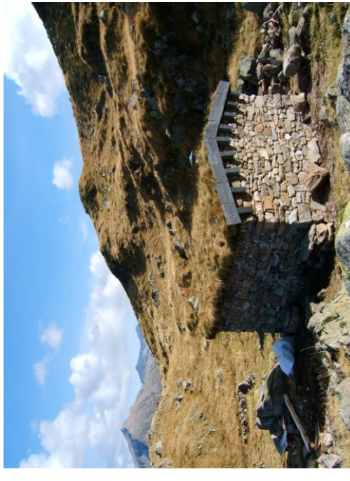
Cabane de la Lacarde

6 cabanes récemment rénovées (avec couchages indépendants, tables, bancs, chauffage bois et pétrole, lampe pétrole) vous accueillent sur des circuits de haute montagne