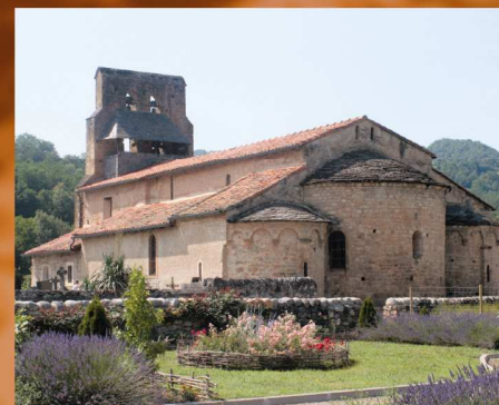
Eglise Notre-Dame de Vic