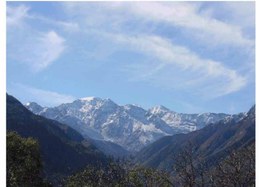
Pic du Montcalm 3077 m - Vallée du Vicdessos

Deux magnifiques cols qui ne demandent qu'à être connus, la vallée de Vicdessos puis celle de l'Ariège vont vous permettre de boucler le tour du département et de rejoindre Foix au terme de cette dernière étape.