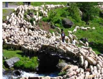
Transhumances en Biros

L'allure fantomatique des bâtiments du Bocard abandonnés depuis des années, ainsi que les anciennes mines de zinc et plomb argentifère du Bentaillou d'Eylie, ne vous laisseront pas indifférents. En effet la ferraille tordue et rouillée semble nous raconter dans un effort désespéré toute l'histoire du combat des hommes pour extraire le minerai des entrailles de la montagne, là-haut, à plus de 1900 m d'altitude. Aujourd'hui vous n'irez pas si haut.