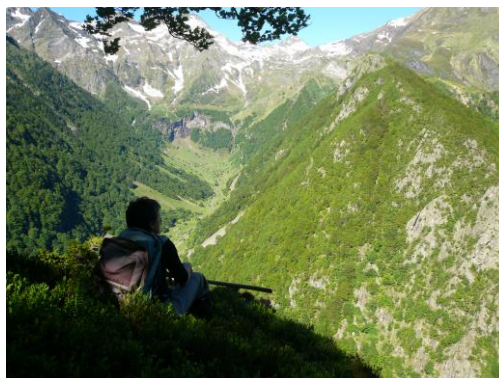
Vue sur le cirque de la plagne

Ce Parcours recommandé et conseillé à tous les marcheurs de 4 à 80 ans. C'est l'indispensable et l'idéale balade de mise en jambes, de pique-nique familial et de farniente ... Les enfants profiteront de ce terrain de jeu naturel à la découverte des richesses de la montagne. Les plus grands percevront les secrets historiques de ce cirque méconnu.